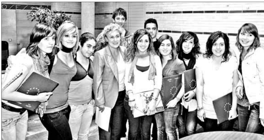
Un grup d'alumnes de l'IES Illa de Rodas ha celebrat el Dia d'Europa.

En els propers dies, més de 200 comerciants de Roses rebran un escrit informatiu amb els nous criteris a aplicar, acompanyat del model de sol·licitud d'autorització que hauran de presentar a l'Ajuntament abans del 5 de juny.