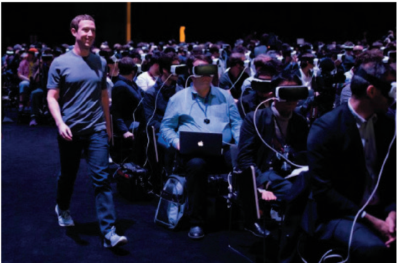
Mark Zuckerberg davant la desatenta mirada del seu públic.

Una multitud d'éssers sols. En aquest món especular, la llibertat es presenta com una caverna amb finestres digitals. Com els hikikomoris, podem estar tranquils de que no hi haurà cap irrupció del real. Podríem dir que l'efecte panòptic que comporta la comunicació digital constreny el que tenim d'humà. És impossible explicar-se a través dels mitjans digitals perquè aquest només tenen una narració additiva, comptable i transparent, mentre que la veritat (entesa a la manera heideggeriana) es presenta com una ocultació. Per tant, a la pura positivitat, exterioritat, transparència i desig d'eficiència dels temps digitals, els hi manca veritat. Seguint una metàfora heideggeriana, Byung-Chul Han afirma que l'ésser humà ha passat de ser llaurador (amb virtuts com la paciència, renúncia, despreniment, recel, compte) a ser caçador d'instant, perdent amb el canvi les característiques essencials que el feien humà. Les Google glass i les ulleres immersives es presenten com la totalització de l'òptica del caçador. Neguen tot allò que no sigui informació perdent així el gaudi més profund de la percepció: la manca d'eficiència. En aquest sentit, recordo que a l'últim Mobile World Congress celebrat a Barcelona, ningú no va veure l'entrada de Mark Zuckerberg perquè tothom duia posades les ulleres immersives de Samsung.